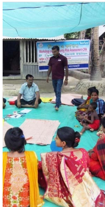
In Bangladesh komt de hele gemeenschap samen om rampenplannen te ontwikkelen en te werken aan duurzame vormen van levensonderhoud. Zo bereidt men zich voor op de toegenomen risico's als gevolg van klimaatverandering.

Maak budgettair ruimte vrij om te investeren in capaciteitsversterking van lokale religieuze actoren omtrent het doen van aanvragen voor institutionele financiering zodat zij beter in staat zijn om succesvolle aanvragen in te dienen.